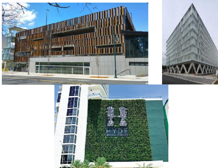
exemple de tratare a fațadelor parcărilor vizibile din circulațiile publice