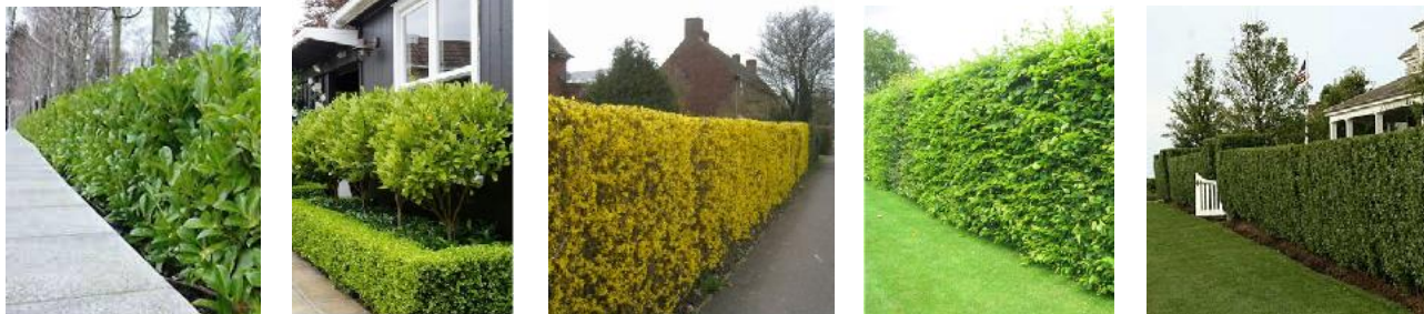
Exemple de împrejuriri cu arbuști decorativi

Pe durata executării lucrărilor de construire, conform autorizației de construire obținute, sunt permise împrejuririle provizorii cu mesh-uri publicitare care promovează investiția realizată, a gardurilor opace din structură metalică, ori alte asemenea, pentru a asigura siguranța spațiilor adiacente șantierului.