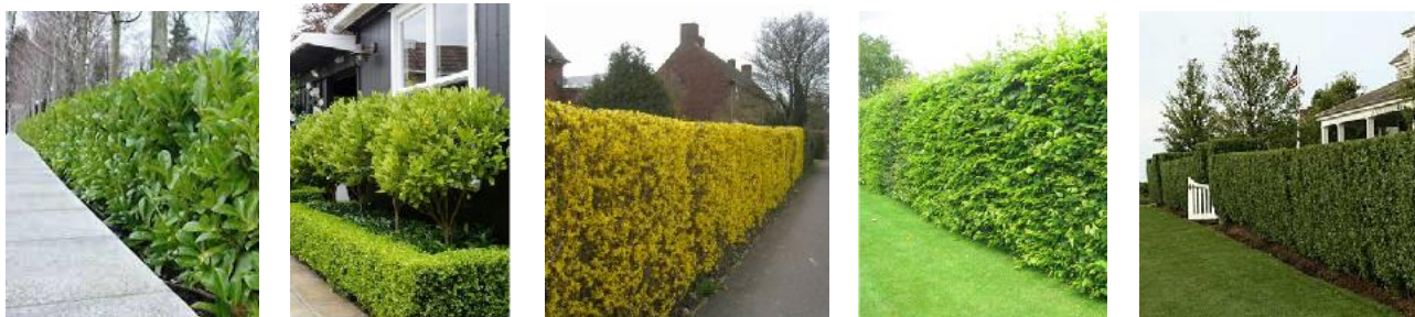
Exemple de împrejuriri cu arbuști decorativi

În situația delimitărilor cu arbuști, înălțimea acestora nu va depăși 1,5 metri. Se vor utiliza arbuști din specii precum buxus sempervirens , Prunus laurocerasus , Hibiscus Syriacus și Hibiscus x "Resi" , Euonimus fortunei sau aurea , Carpinus betuluis pentru densitatea coronamentului și a posibilităților de toaletare variate.